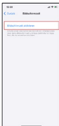
Aktiviere die Bildschirmzeit