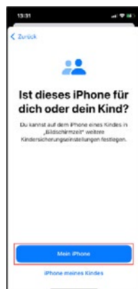
Wähle, für wen du die Bildschirmzeit einrichten möchtest