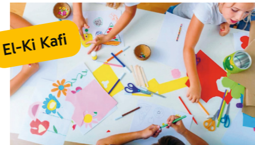
Kuschelecke, Spielkiste, feiner Kaffee. Hier fühlen sich Gross und Klein gleich wohl. Zänti Einkaufszentrum, 8604 Volketswil