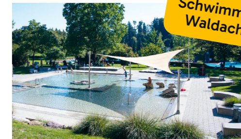
Sommer, Sonne, Familienzeit: Das Bad bietet alles für entspannte Stunden mit den Kleinsten. Waldackerweg, 8604 Volketswil