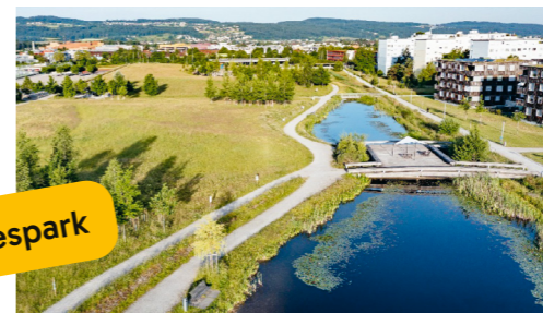
Vier fantasievolle Spielwelten mit Holzfiguren wie Libelle oder Spinne. Ideal zum Toben und Staunen. Im Zentrum 18, 8604 Volketswil